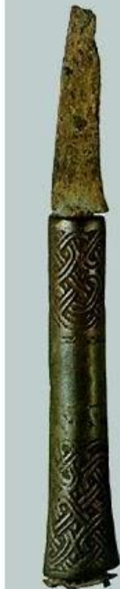
Нож железный с бронзовой рукоятью. Длина 14 см. XIII в.

Темірден жасалған әр түрлі қару- жарақтар. X – XII ғасырлар.