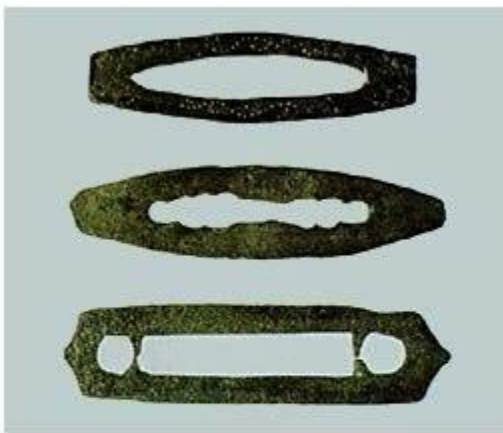
Кресало железное а) длина 11,3 см; б) длина 11 см; в) украшено точечным орнаментом, длина 9,5 см. Начало XIII в.