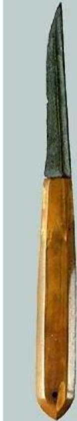
Нож железный с костяной рукоятью. Длина 20 см. XII в.