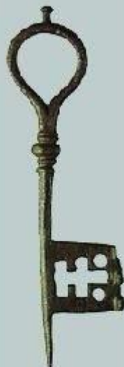
Ключ от внутреннего замка. Железо. Длина 10,6 см. XII в.