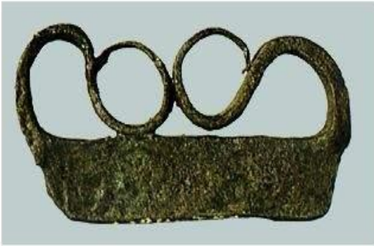
Кресало Железо. Длина 5,7 см. XIII в.