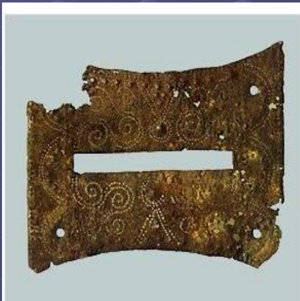
Личина нутряного замка

Орнамент нанесен техникой оловянной инкрустации.