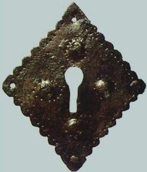
Личина нутряного замка

Орнамент нанесен техникой оловянной инкрустации.