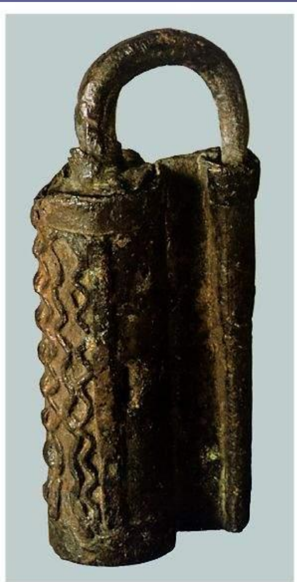
Замок. Железо. Длина 8,5 см. XII в.

Темірден жасалған құлып. Ұзындығы – 8,5 см. XII ғасыр.