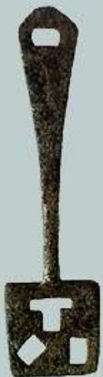
Ключ от навесного замка. Железо. Длина 12 см. XI в.