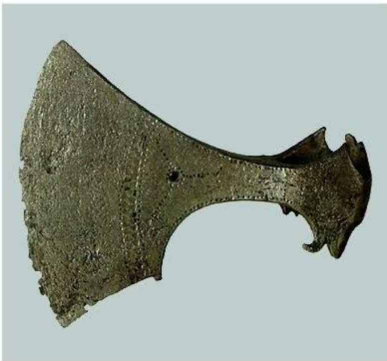
Топор боевой орнаментированный. Железо. Длина 16 см. XI в.