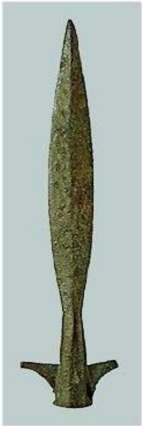
Наконечник копья ланцетовидный. Железо. Длина 35 см. X в.