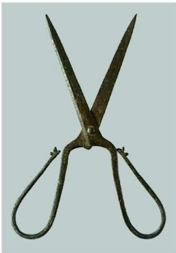
Ножницы Железо. Длина 15,5 см. Вторая половина XIV в.

Ерте кездегі темірден жасалған қайшы. Ұзындығы – 15,5 см. XIV ғасырдың екінші жартысы.