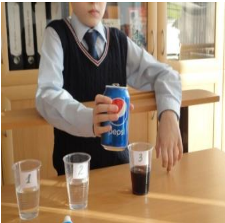
Стаканчик №3 с «Кока-Колой»