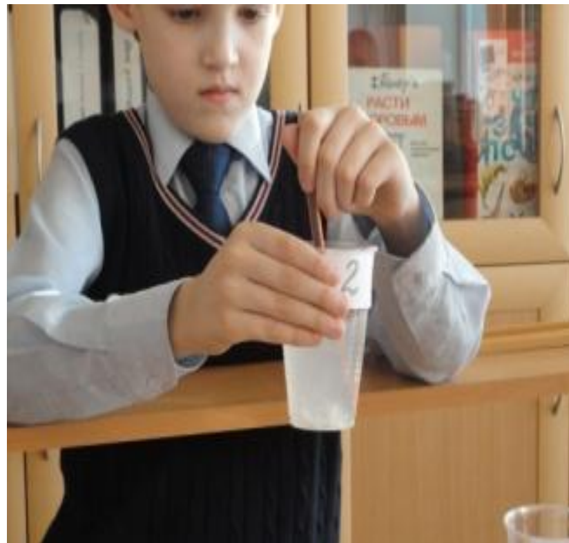
Стаканчик №2 с растворённой зубной пастой чистой водой