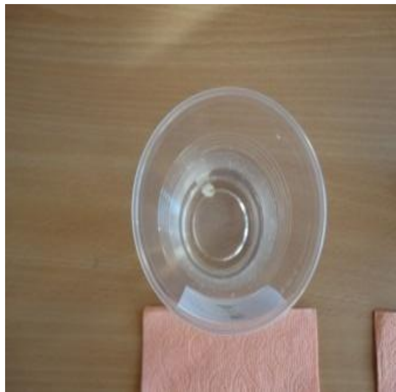
Я поместил в эти стаканчики выпавшие молочные зубы.