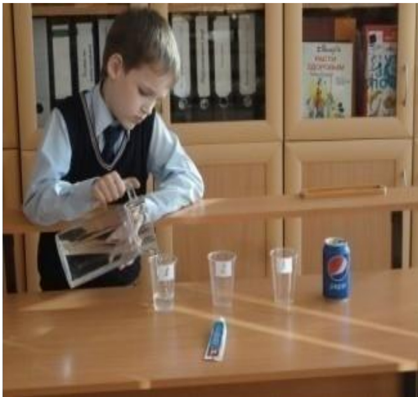
Стаканчик №1 с чистой водой