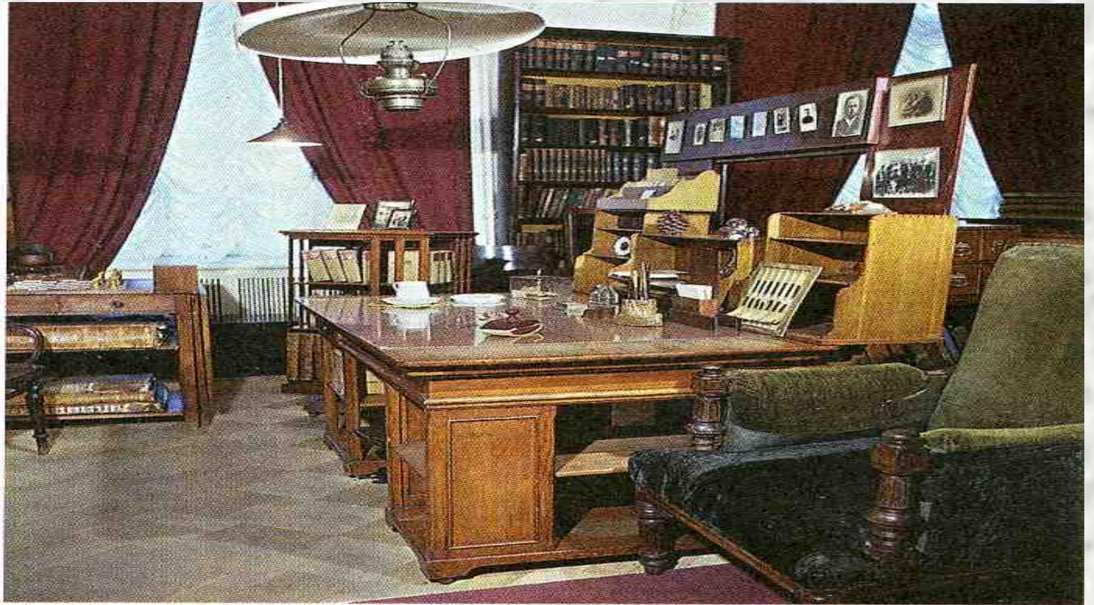
Кабинет Д.И. Менделеева