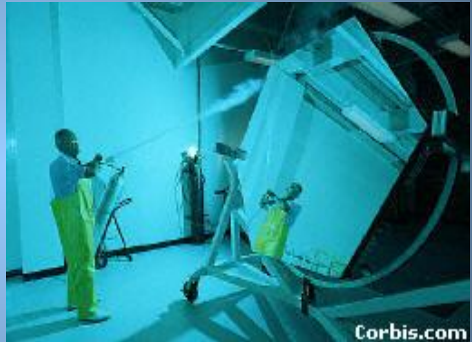
Действие углекислотного огнетушителя