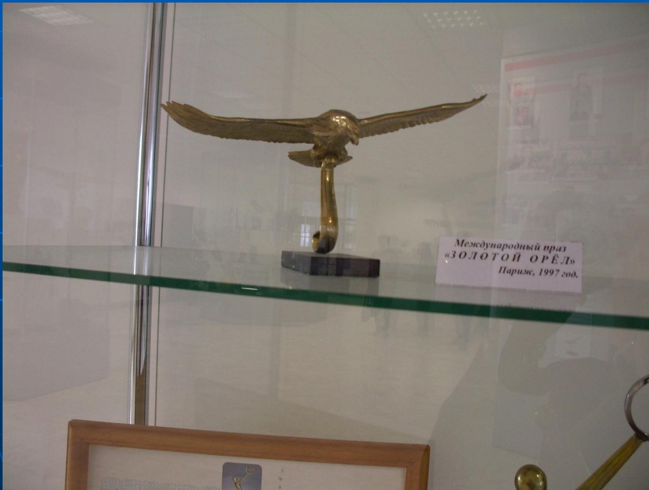
Международный приз «ЗОЛОТОЙ ОРЁЛ» Париж, 1997 год.