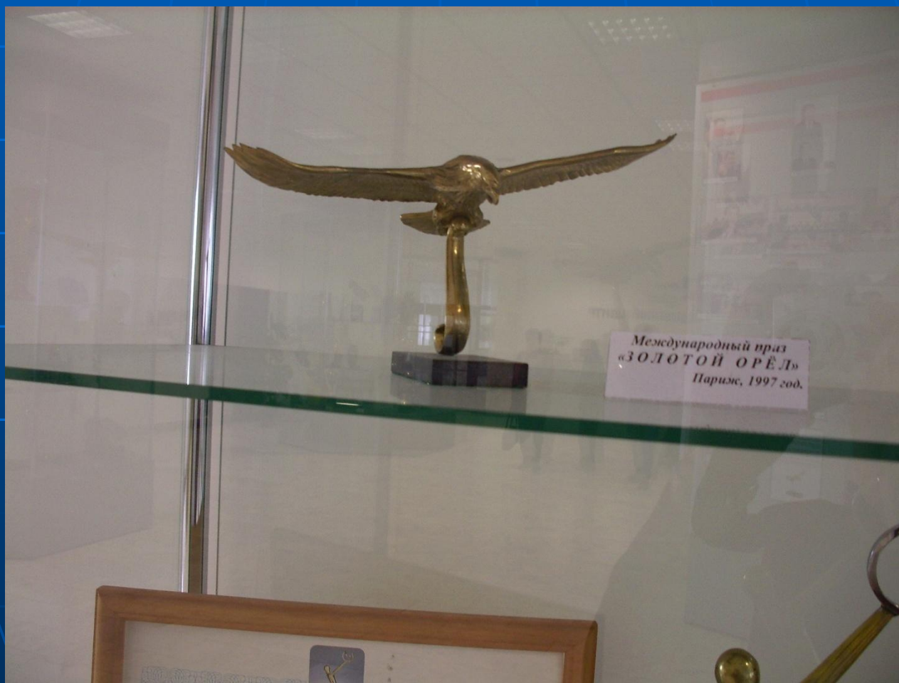
Международный приз «ЗОЛОТОЙ ОРЕЛ» Париж, 1997 год.