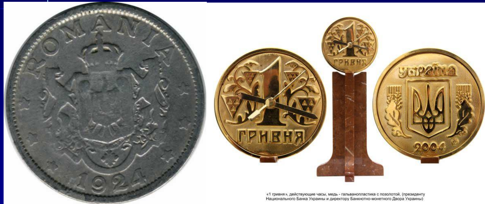
«1 гривня», действующие часы, медь - гальванопластика с позолотой, (президенту Национального Банка Украины и директору Банкіотно-монетного Двора Украины)