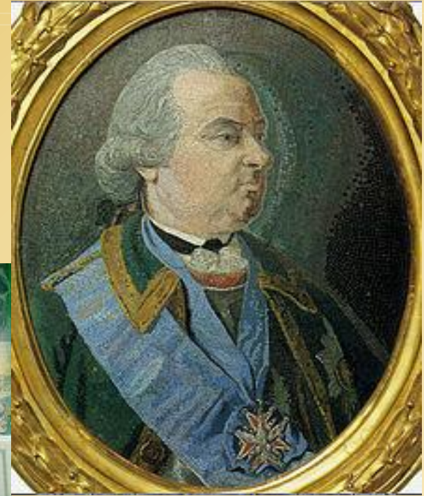
Мозаичный портрет П. И. Шувалова