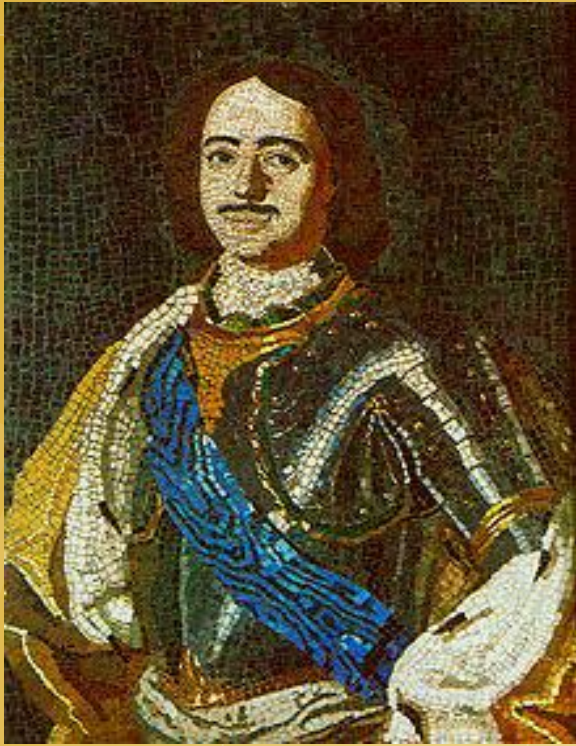
Портрет Петра I