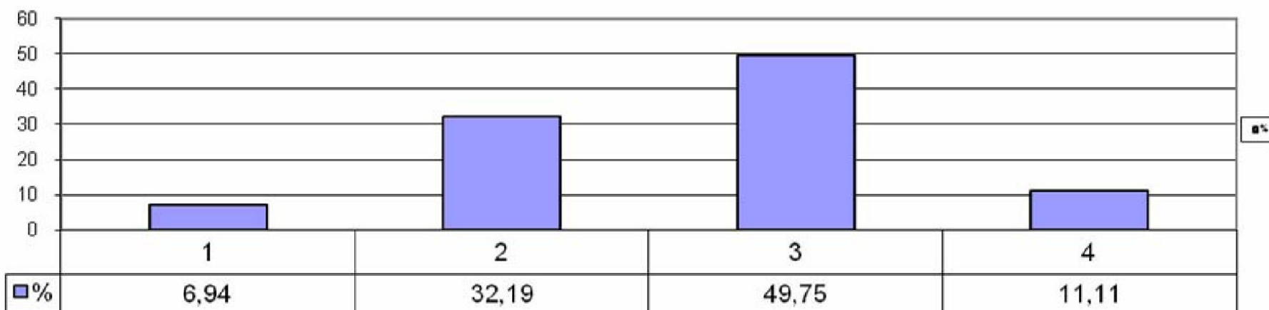
Распределение групп баллов

неудовлетворительный – 0–31 / 0–12, удовлетворительный – 32–56 / 13–35, хороший – 57–77 / 36–56, отличный – 78–100 / 57–66