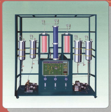
сверхкритическая флюидная экстракция