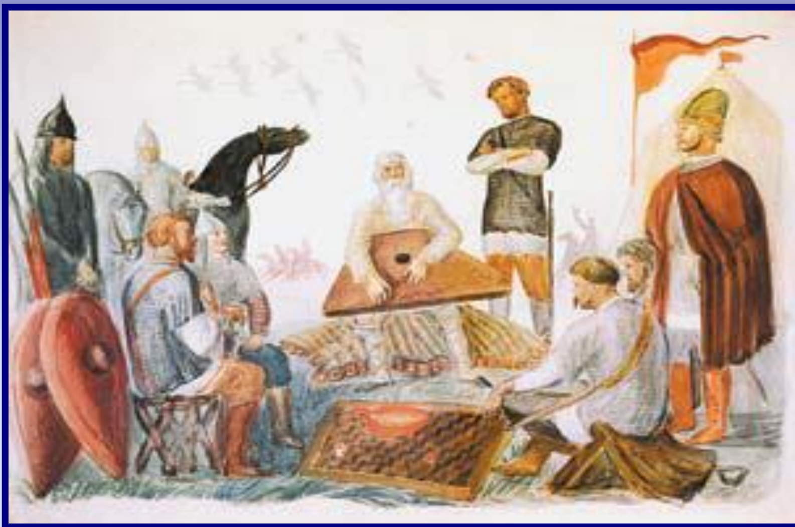
Сказание о полку Игореве