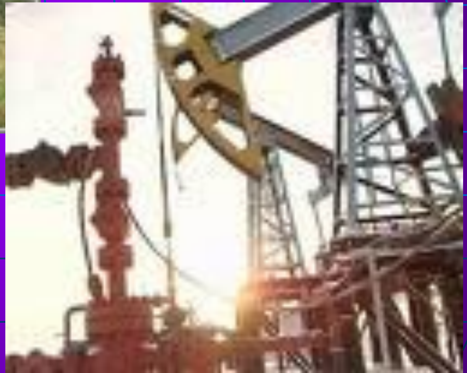
Станок – качалка нефти