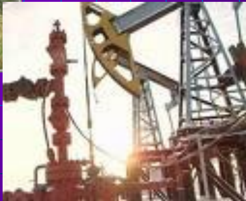
Станок – качалка нефти