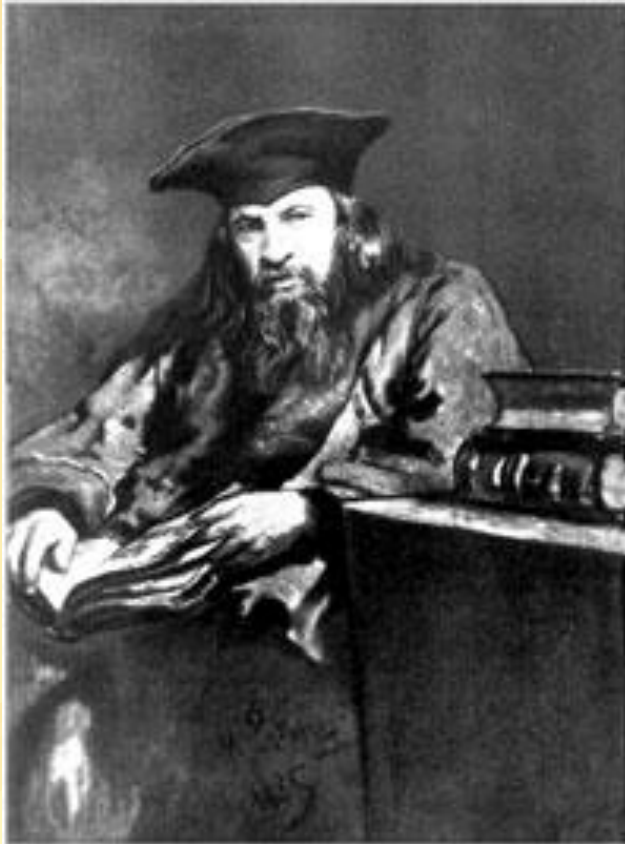
Д. И. Менделеев в мантии магистра наук.

При Деятельном участии Д.И. Менделеева было создано Русское химическое общество /ныне Всесоюзное химическое общество имени Д.И. Менделеева/.