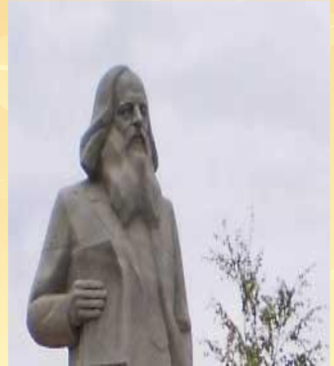
Памятник Д.И. Менделееву в Тобольске.

Российская Академия наук забаллотировала кандидатуру Менделеева в академики из-за его прогрессивных взглядов.