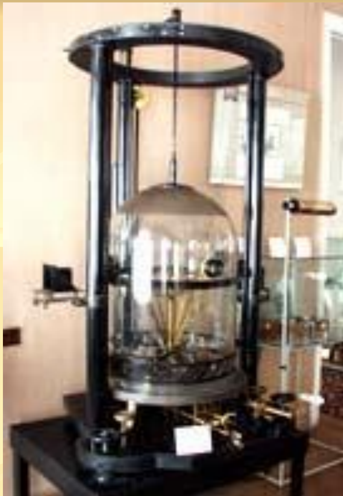
Метрологический музей Госстандарта России

■ С ноября 1882 г. Д.И. Менделеев принял предложенную ему должность хранителя Депо образцовых мер и весов, впоследствии названное Главной палатой мер и весов.