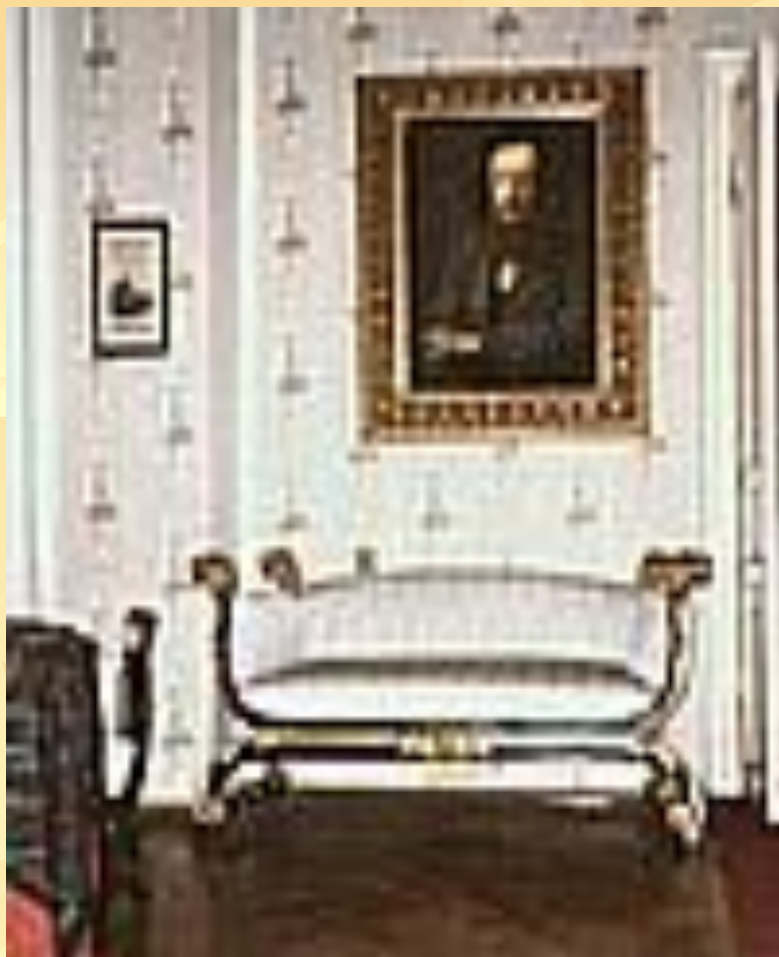
Музей – архив Д.И.Менделеева