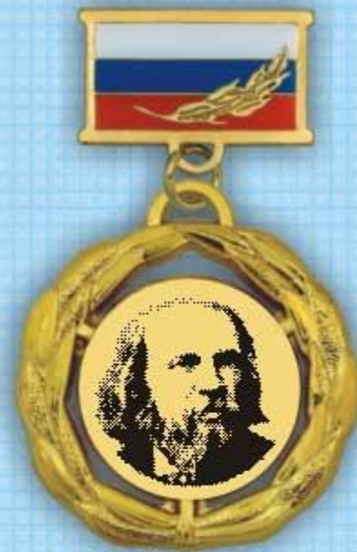
Юбилейная медаль К 175-летию со дня рождения Дмитрия Ивановича МЕНДЕЛЕЕВА

На всех родных самое сильное впечатление произвела несметная толпа народа, провожавшая ученого в последний путь. Молодежь несла в руках периодические таблицы. Это было лучшим венком и лучшим украшением на похоронах ученого, трудившегося всю жизнь для своей страны.