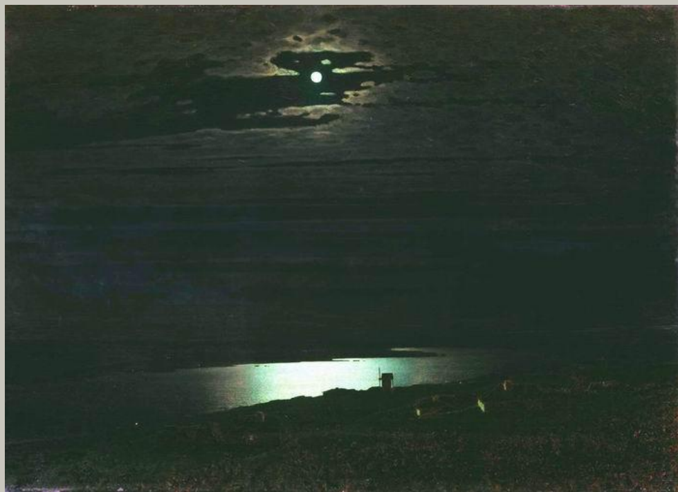
А. И. Куинджи «Лунная ночь на Днепре»