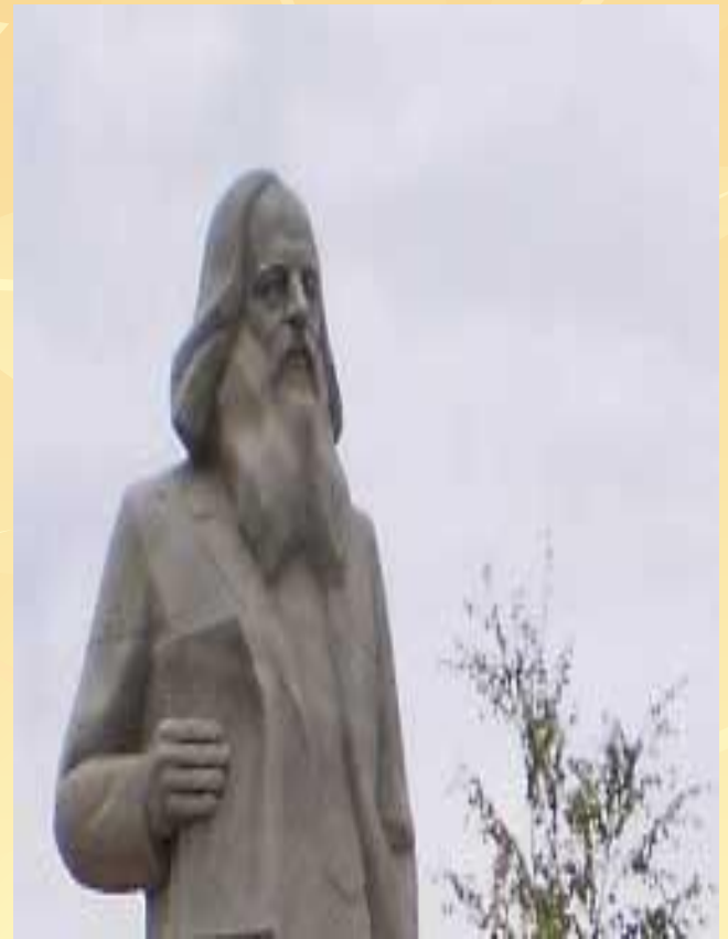
Памятник Д.И. Менделееву в Тобольске.

Российская Академия наук забаллотировала кандидатуру Менделеева в академики из-за его прогрессивных взглядов.