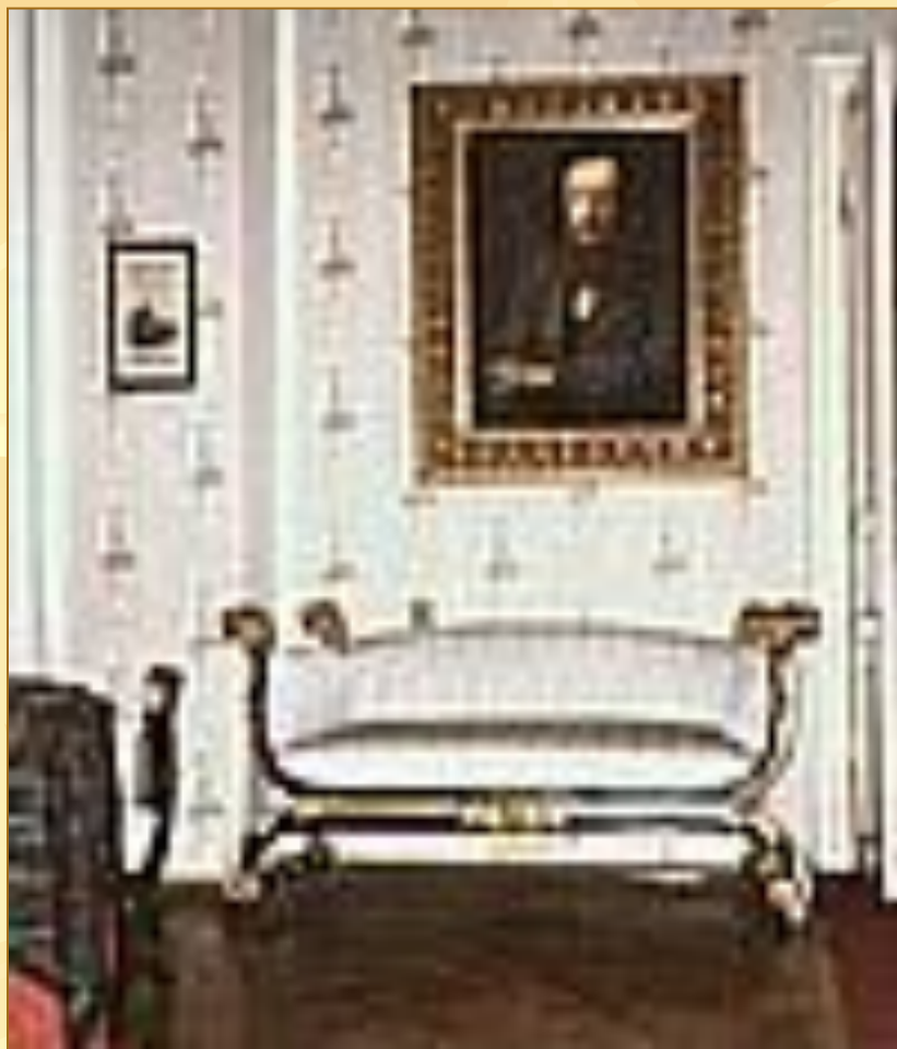
Музей – архив Д.И.Менделеева