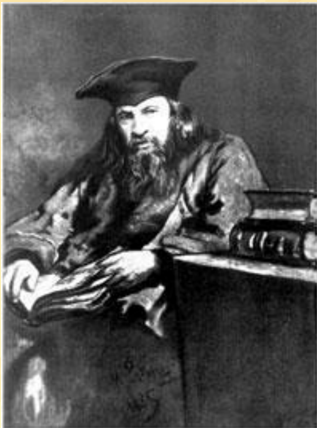
Д. И. Менделеев в мантии магистра наук.