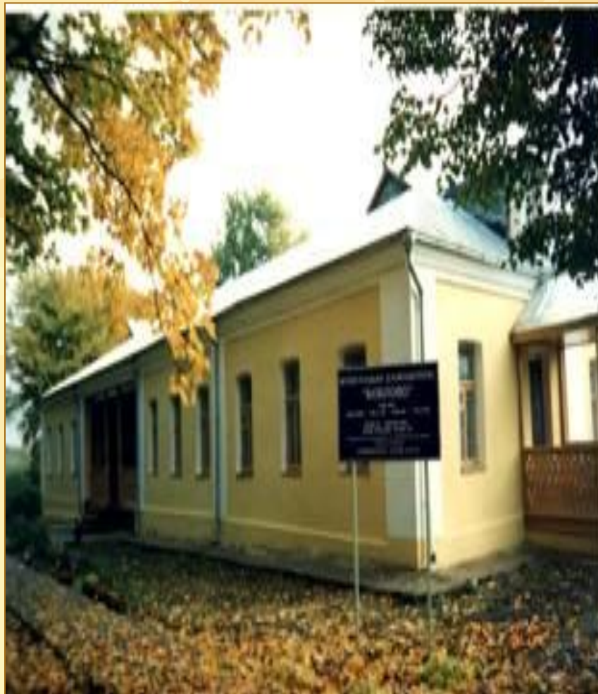
Музей – усадьба Боблово