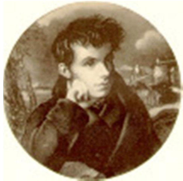
Василий Андреевич Жуковский. (1783 – 1852)

При мысли великой, Что я человек, всегда Возвышаюсь душой.