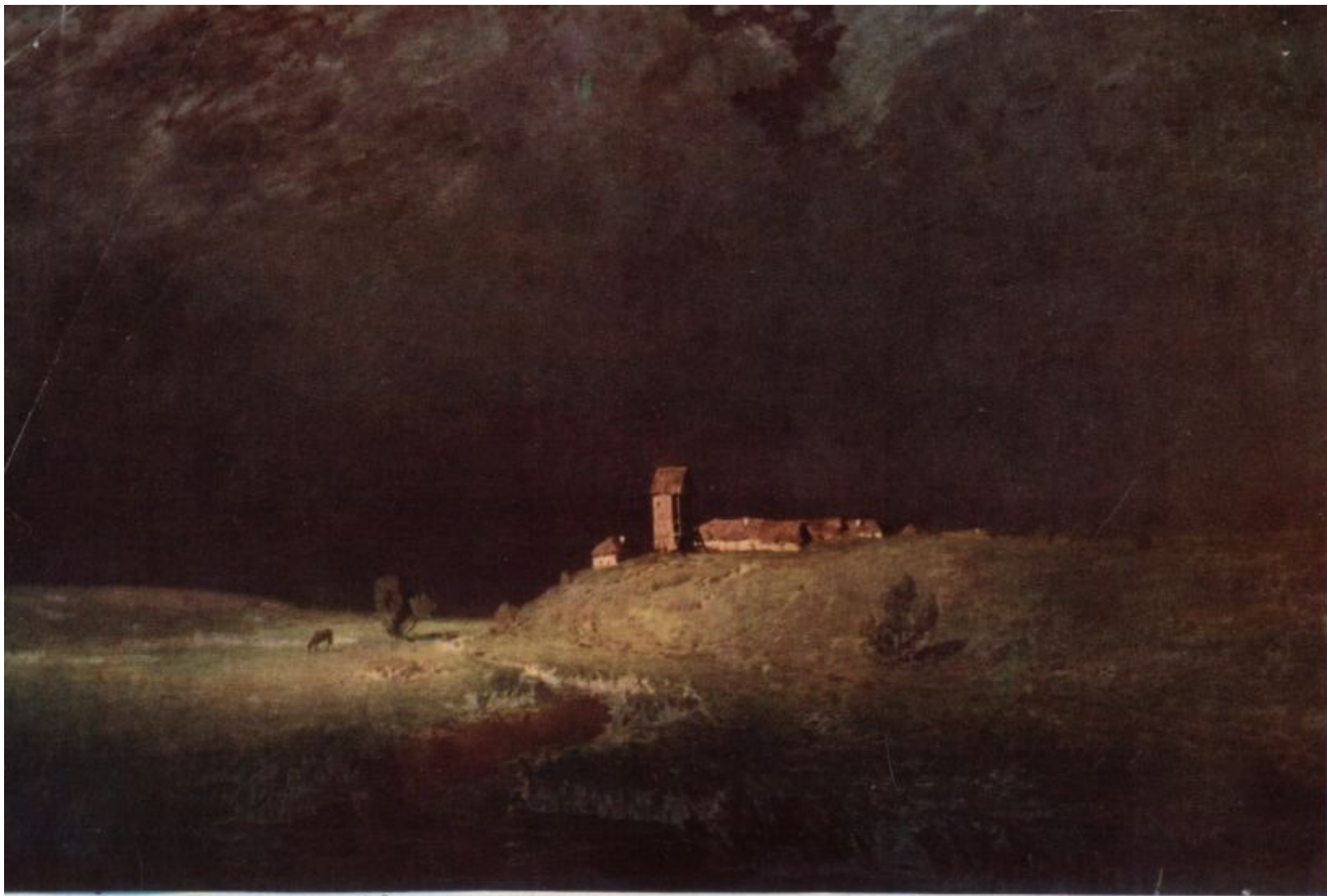
А. Куйнджи. 1842—1910. ПОСЛЕ ГРОЗЫ. 1879.