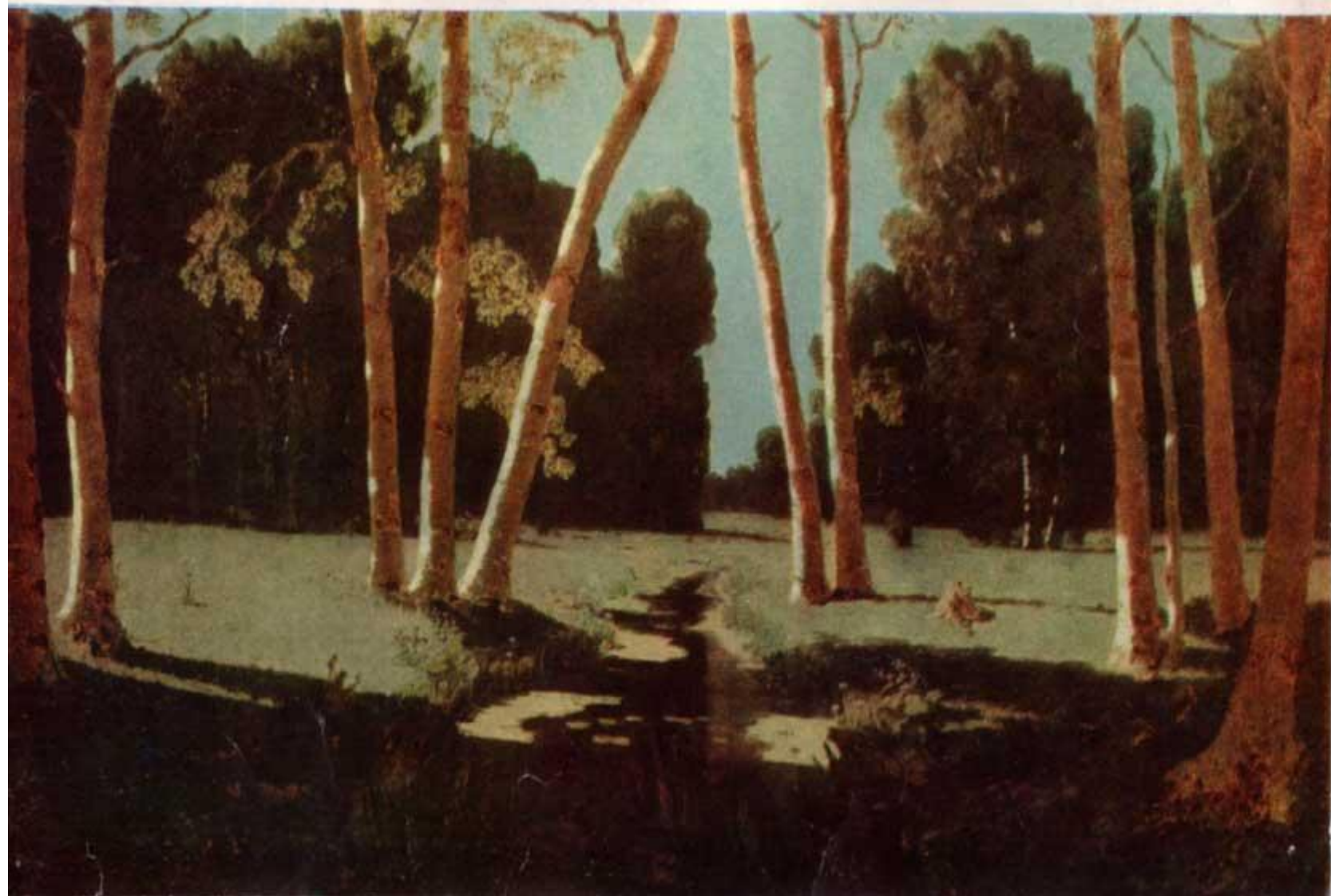
БЕРЕЗОВАЯ РОЩА. 1879.