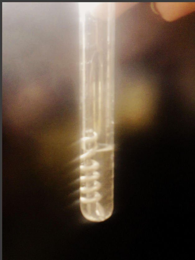
Использование алюминиевой проволоки.