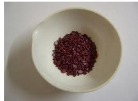
Гидроксид железа (III)