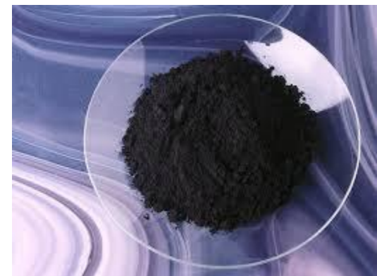
Гидроксид свинца (II)