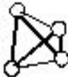
Белый фосфор (P 4 )