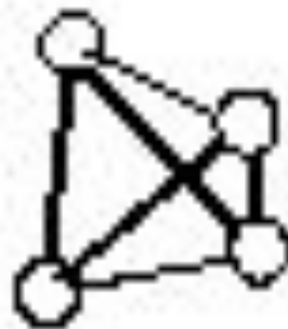
Белый фосфор (P 4 )