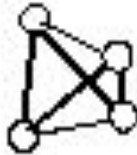
Белый фосфор (P 4 )