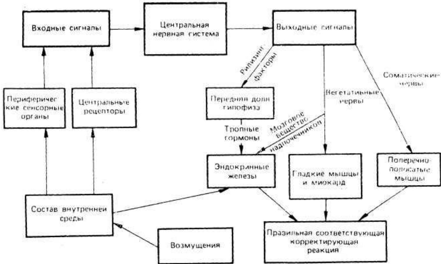
Схема связей между входными и выходными сигналами и центральной нервной системой