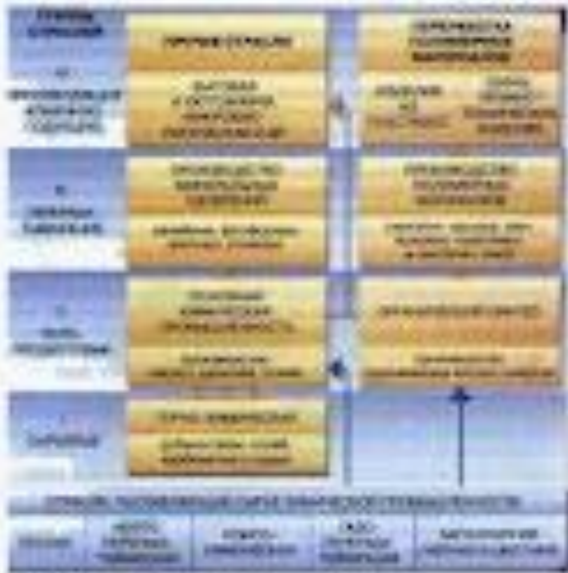
Fig. 10.10 (Continued) showing the interactions between the various entities.