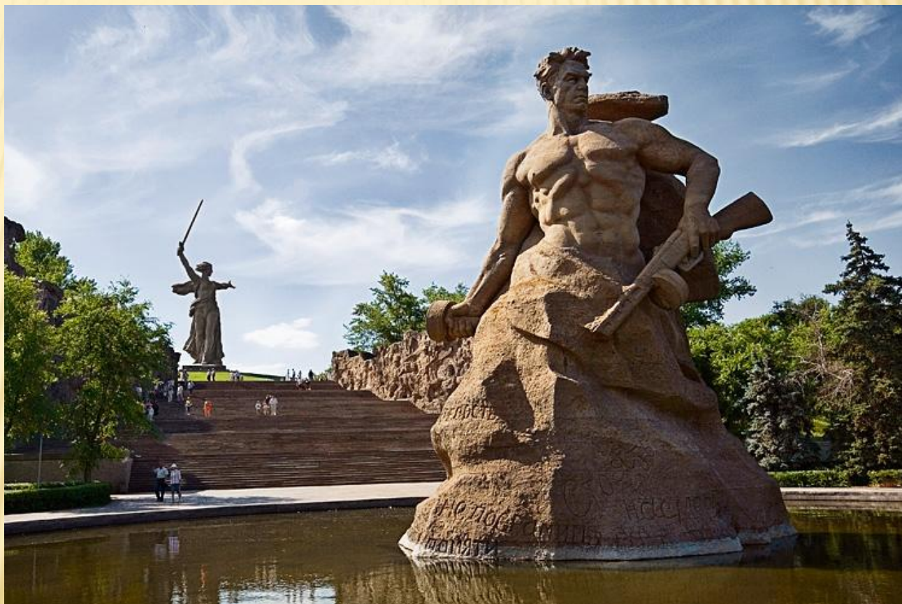
На фото: Мамаев Курган

расположен в Центральном районе города Волгограда, где во время Сталинградской битвы происходили ожесточённые бои (особенно в сентябре 1942 года и январе 1943) продолжительностью 200 дней.