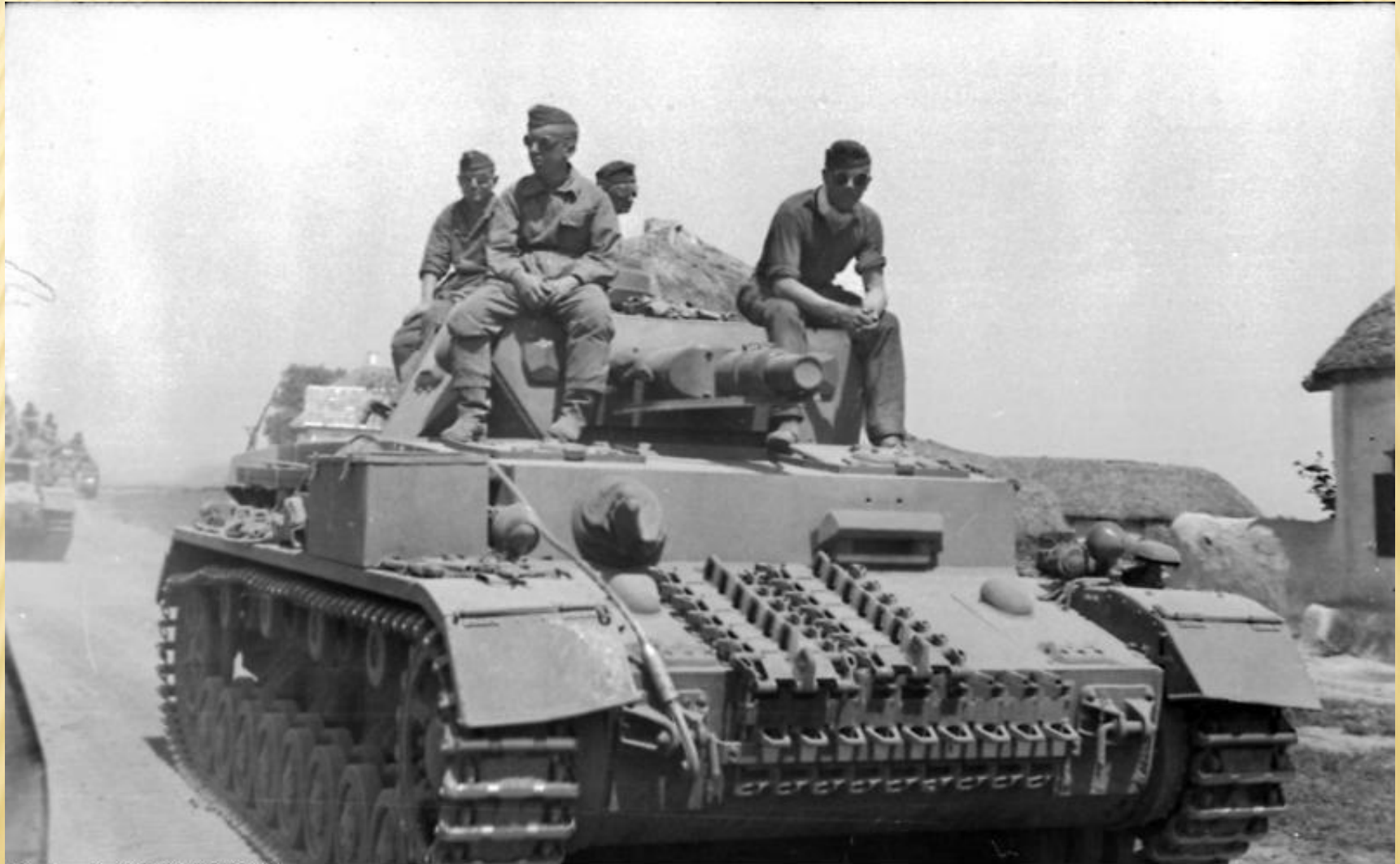
Juni 1942