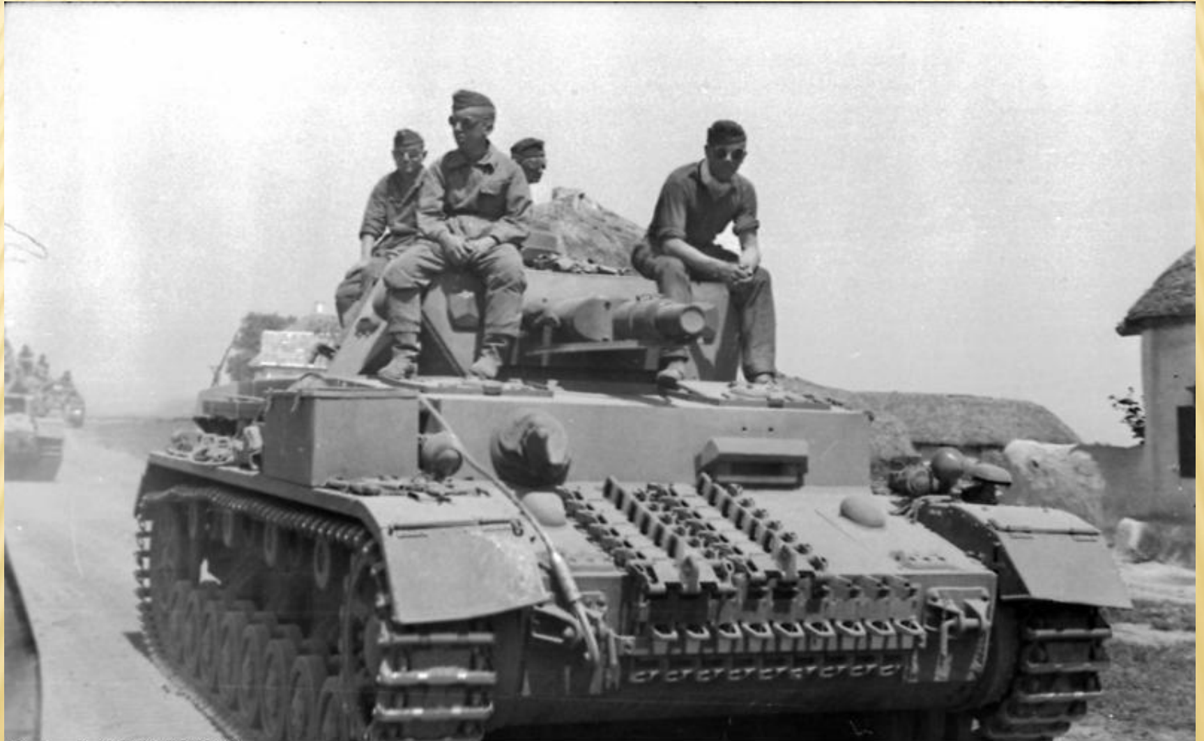
Juni 1942