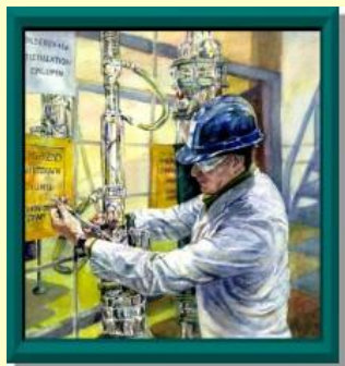
Инженер на химическом производстве