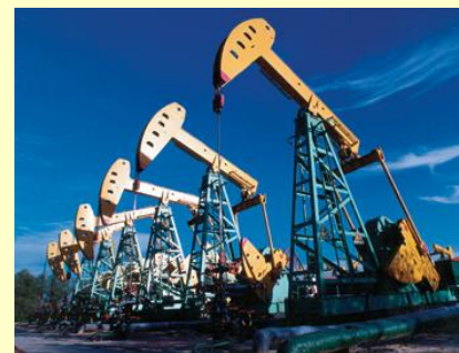
Инженер на предприятиях добывающих и перерабатывающих отраслей