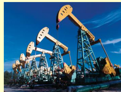
Инженер на предприятиях добывающих и перерабатывающих отраслей