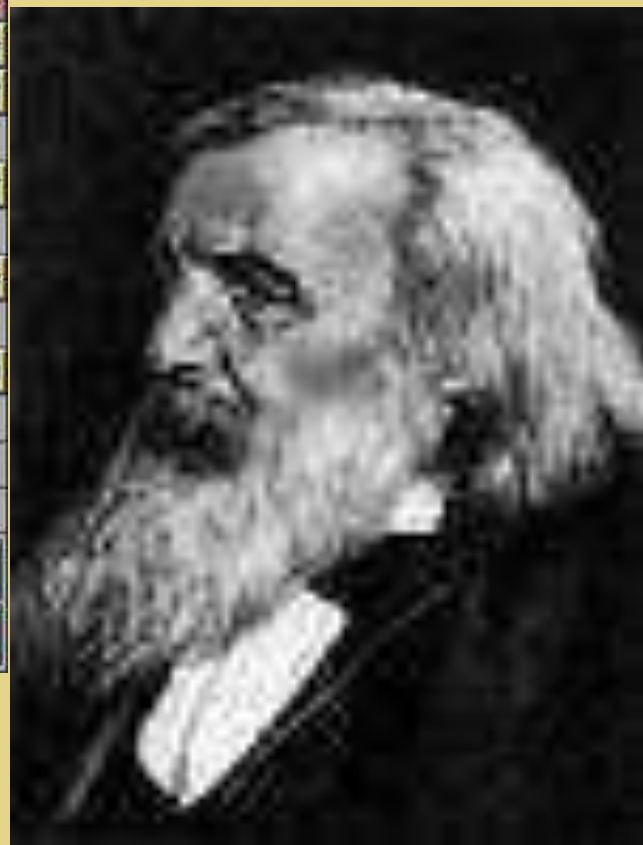
Д. И. Менделеев русский ХИМИК