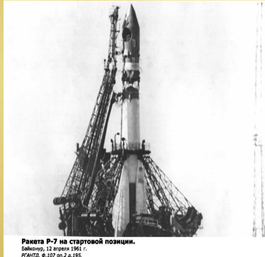
Ракета Р-7 на стартовой позиции. Байконур, 12 апреля 1961 г.