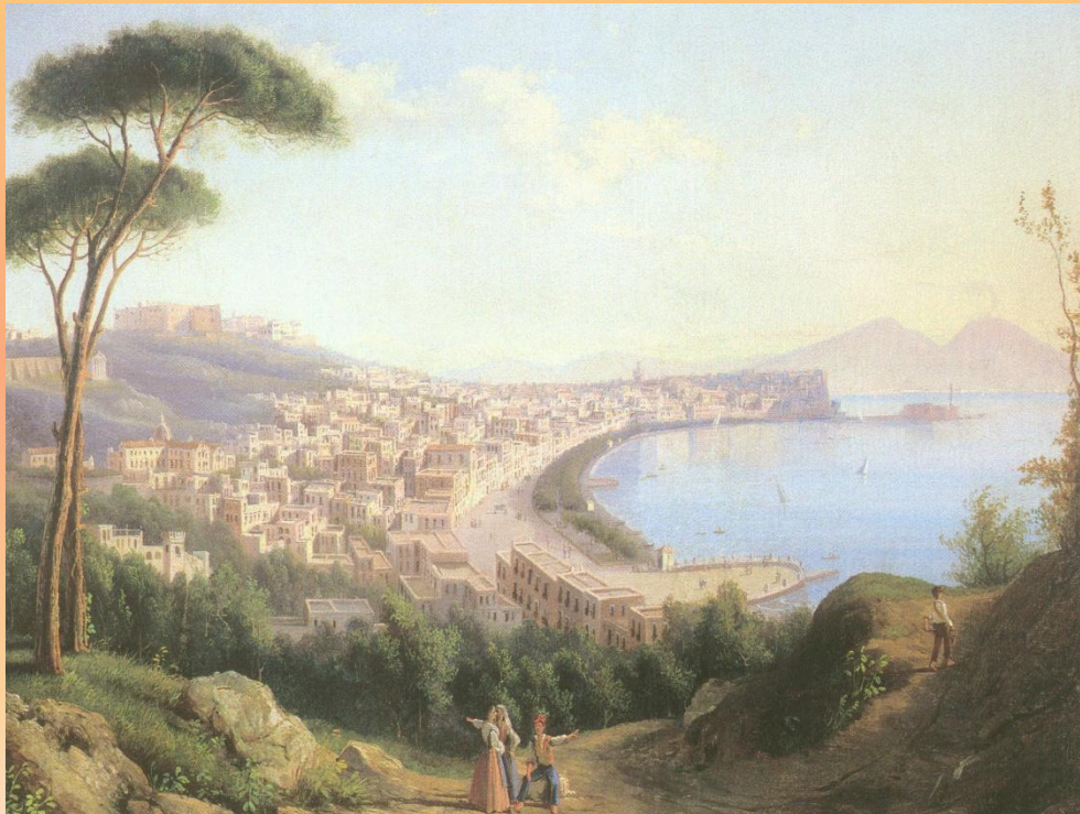
СИЛЬВЕСТР ЩЕДРИН «ВИД НА НЕАПОЛЬ С ДОРОГИ В ПОЗИЛИППО»