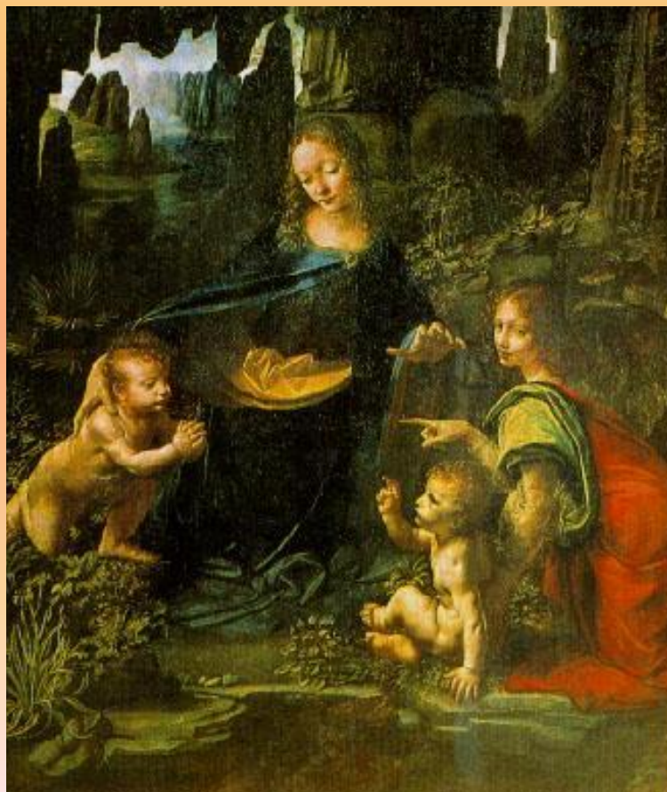
ЛЕОНАРДО ДА ВИНЧИ «МАДОННА НА СКАЛАХ»

Фреска (от итал. fresco – свежий), живопись по сырой (свежей) штукатурке разведенными на чистой или известковой воде красками; а также техника стенных росписей, позволяющая создавать монументальные композиции, органически связанные с архитектурой.