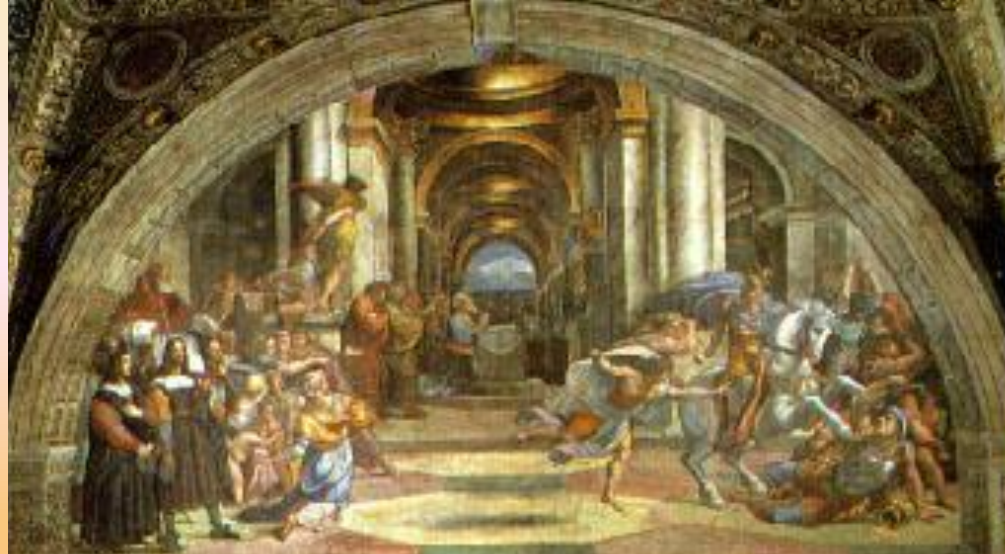
РАФАЭЛЬ «ИЗГНАНИЕ ГЕЛИОДОРА»