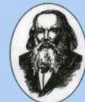
Д.И. Менделеев 1834–1907