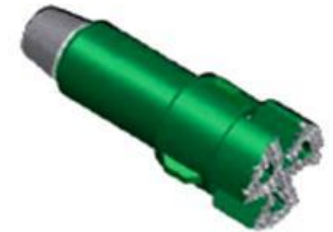
Bladed Junk Mill