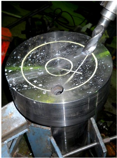
12 ¼ д. Сыртқы фреза