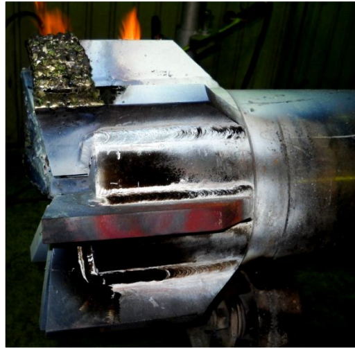
14 ¾ д. Сыртқы реза