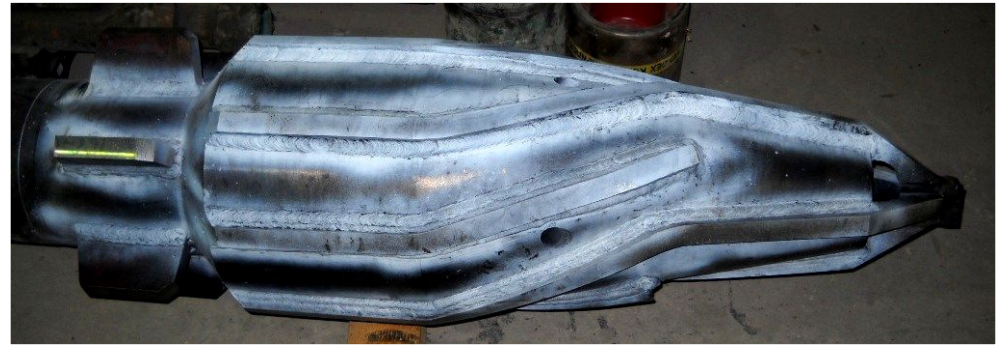
14 ¾ д. Конусты фреза