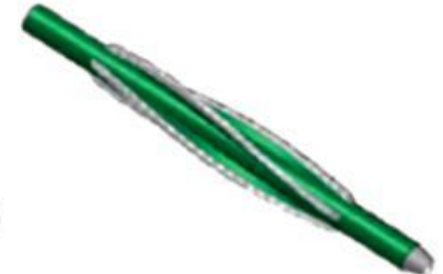
String Taper Mill