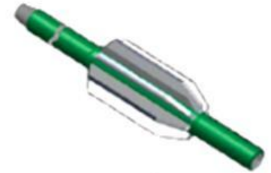
Conductor Taper Mill