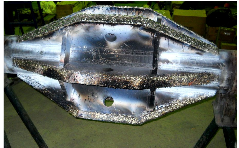
26 д. Бағанды фрезер