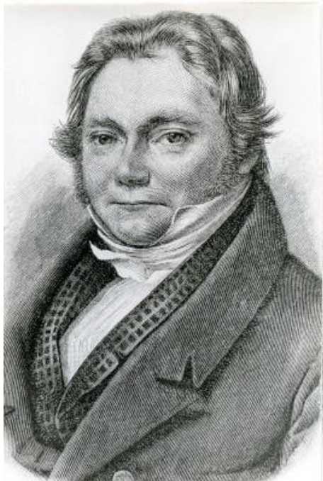
Jöns Jakob Berzelius