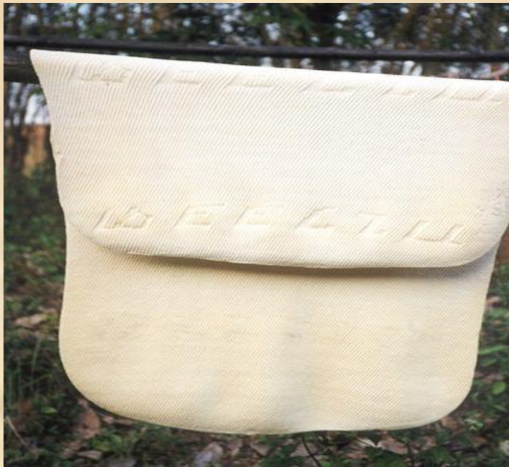
Коврик из каучука