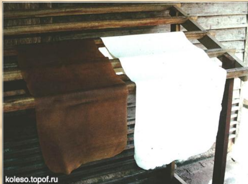
Лепёшка из свежего каучука