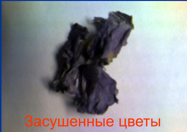
Засушенные цветы фиалки