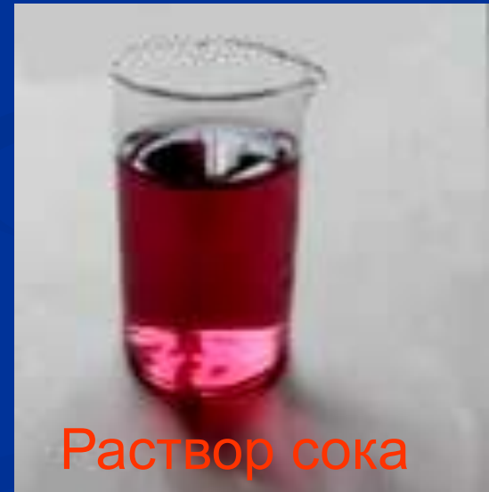
Раствор сока черноплодной рябины