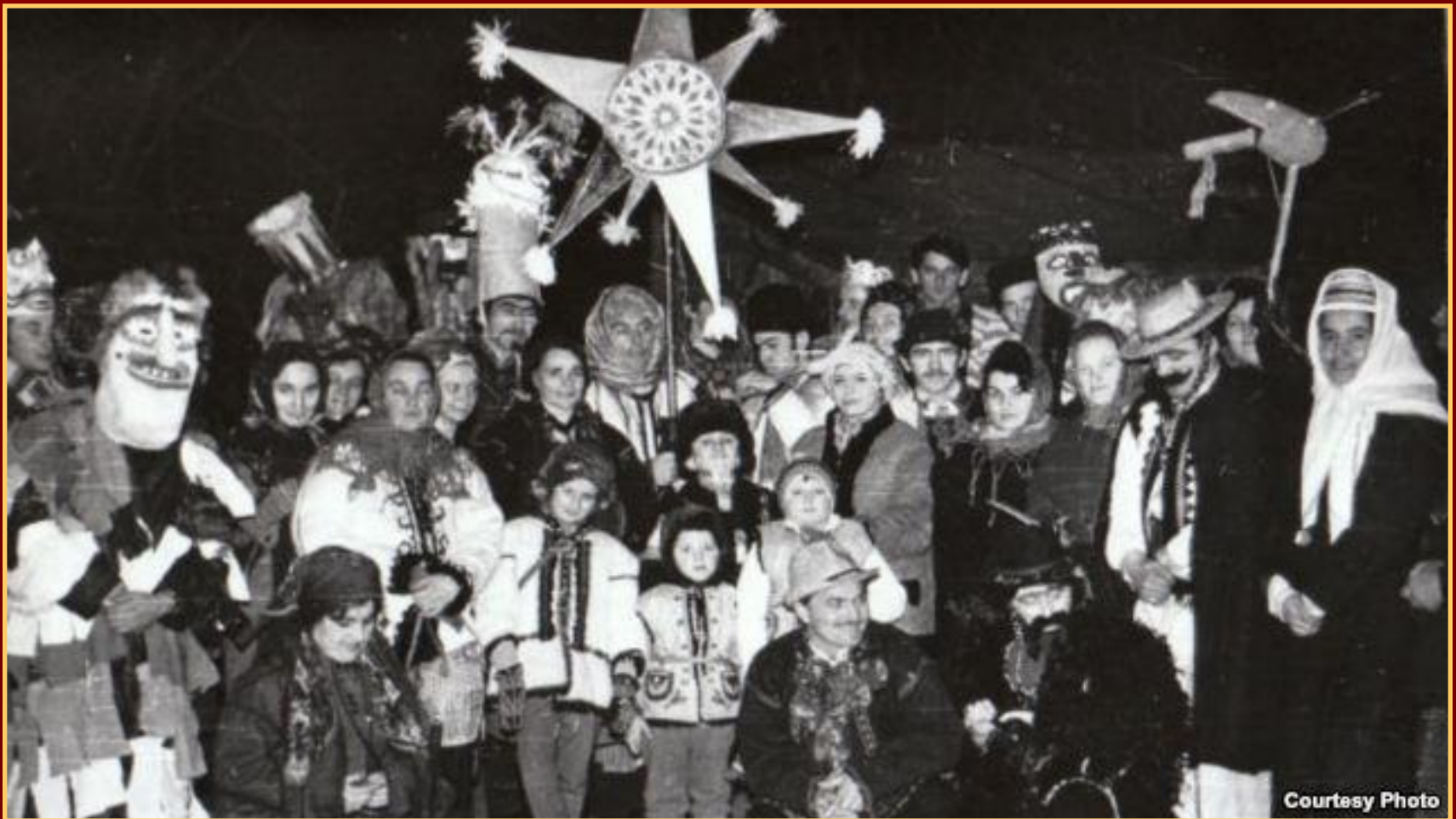
Вертеп шістдесятників у Львові, 1972 рік