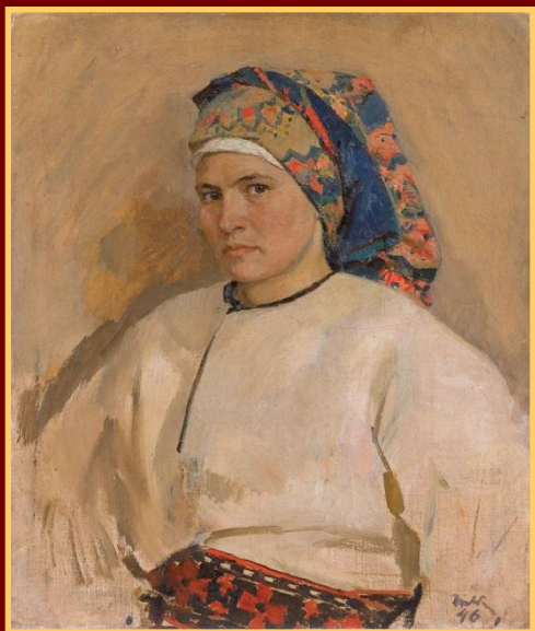
Тетяна Яблонська «Автопортрет»