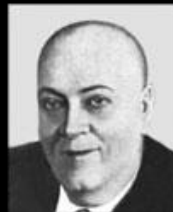
А.Е. Ферсман (1883–1945)