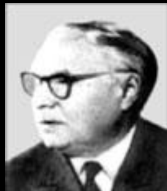
Н.Н. Мельников (1908–2000)