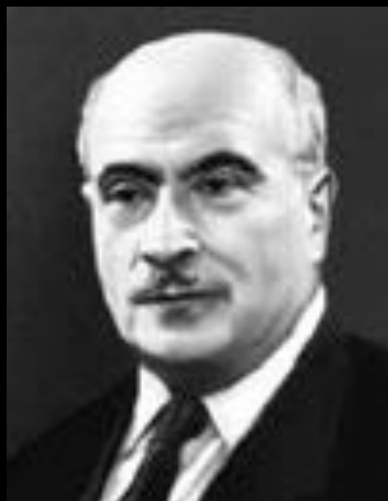
С.И. Вольфович (1896–1980)