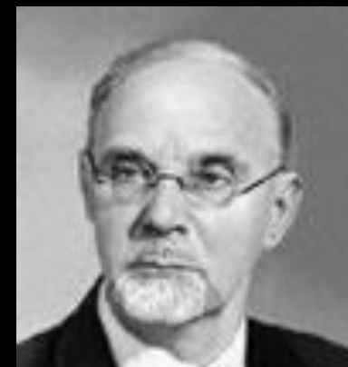
А.Е. Арбузов (1877–1968)