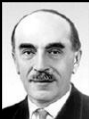
Н.Н. Семенов (1896–1986)