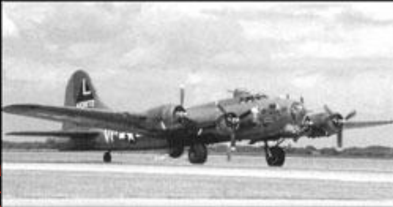
Тяжелый высотный бомбардировщик «Боинг» В-17. 1940-е гг. США