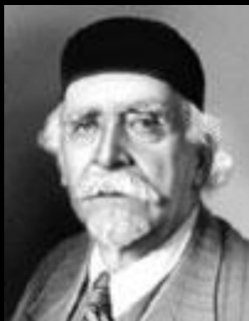
Н.Д. Зелинский (1861–1953)