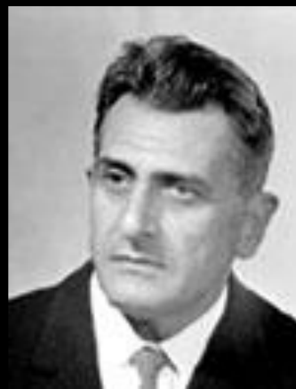
И.Л. Кнуянц (1906–1990)