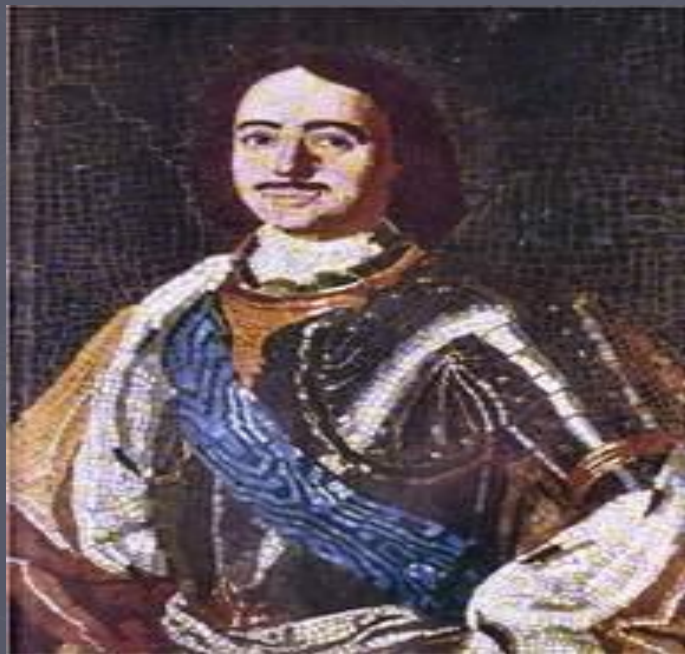
Петр Великий. Мозаика работы М.В.Ломоносова

Ломоносов создал великолепные мозаичные картины: «Полтавская баталия», «Лик Богородицы», ряд портретов (например, портреты Петра I, Екатерины II, Елизаветы Петровны и др.). Мозаичные работы Ломоносова были высоко оценены российской Академией художеств, избравшей его в 1763 г. своим членом.