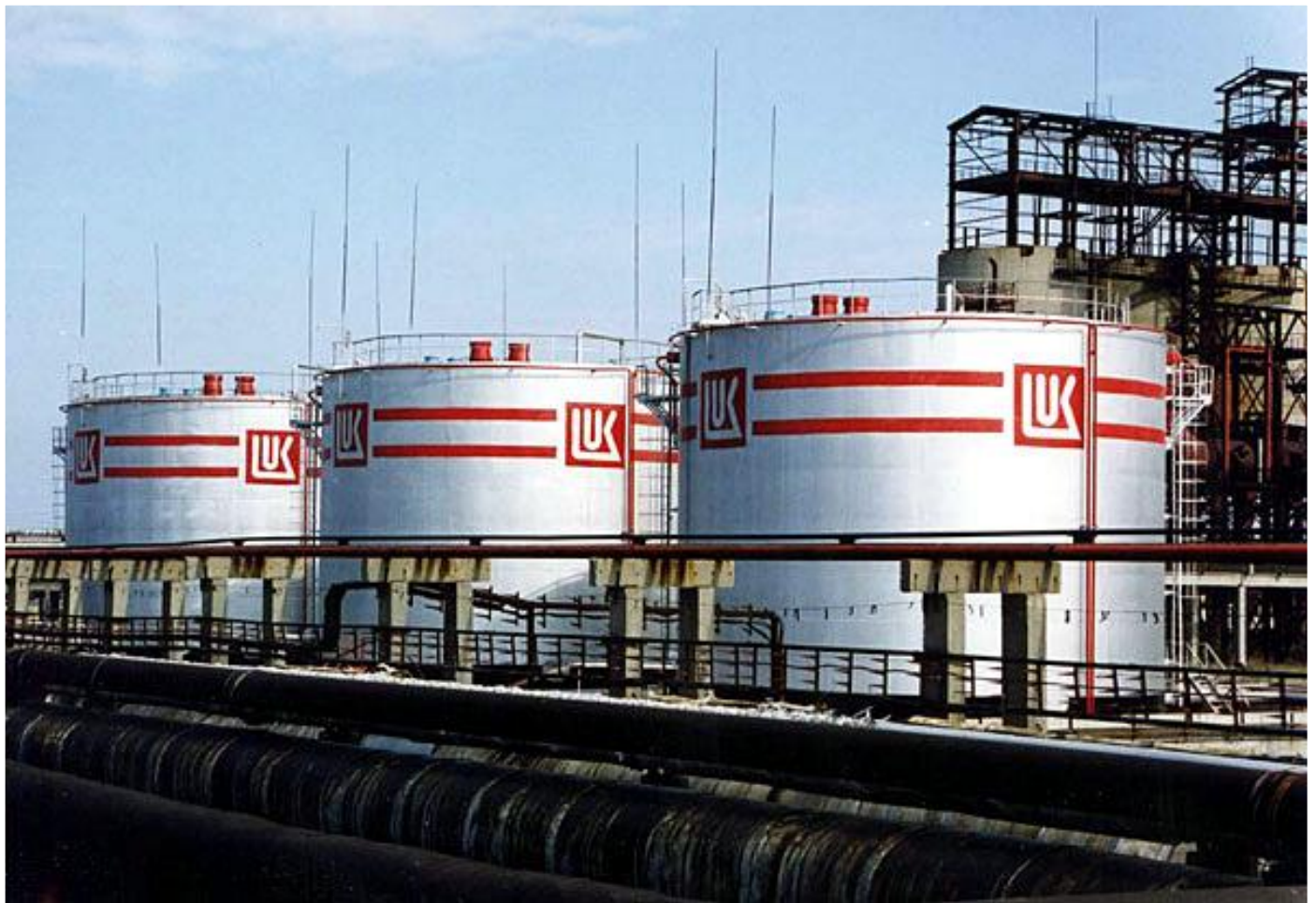
Одеський нафтопереробний завод