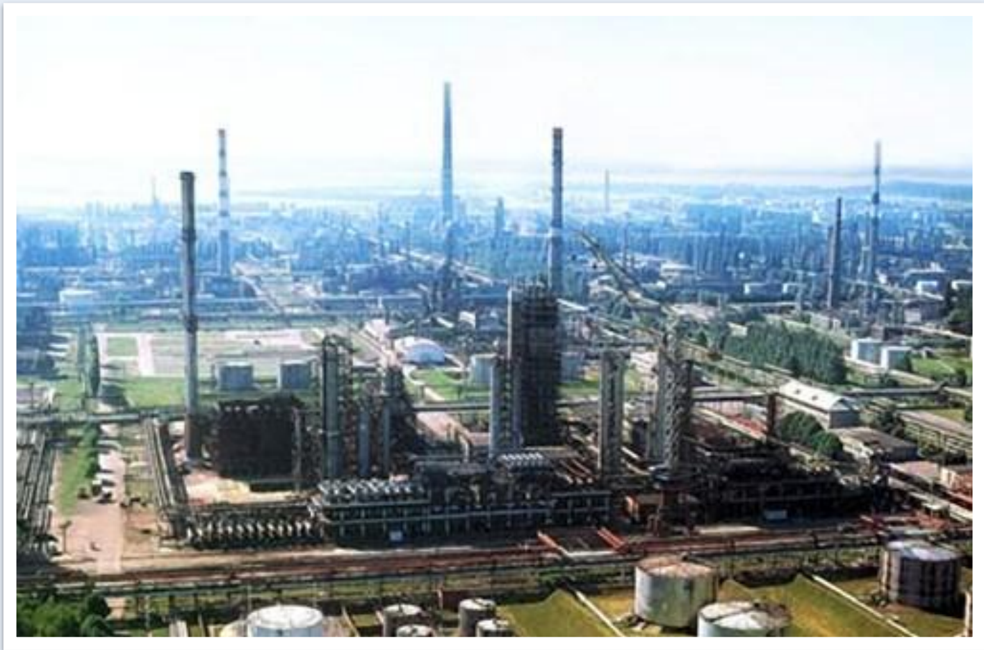
Кременчуцький нафтопереробний завод