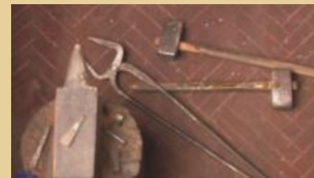
Топор, щипцы, ножницы большие крепкие, наковальня, молотки и кузнечные молоты

Кроме печей различной конструкции и назначения, лаборатория была оснащена химической посудой, различным оборудованием и приборами. В связи с необходимостью проводить исследование руд и других природных материалов М.В. Ломоносов уделил большое внимание оборудованию для пробирного анализа..