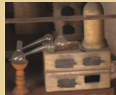
«Атакор» для выпаривания и перегонки