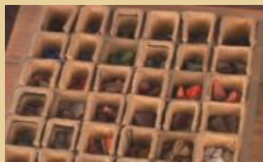
Ящик для мозаики природных материалов М.В.