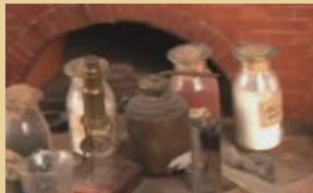
Микроскоп. Перегонный куб