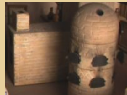
Печь для варки стекла

«Мы озаботились устроить их, — писал М. В. Ломоносов, — ввиду многообразного ежедневного их употребления: ведь все химические операции, производящиеся огнем, можно в них осуществлять надлежащим образом, если потребует необходимость».