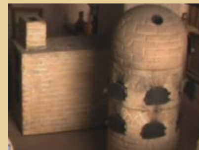
Печь для варки стекла

«Мы озаботились устроить их, — писал М. В. Ломоносов, — ввиду многообразного ежедневного их употребления: ведь все химические операции, производящиеся огнем, можно в них осуществлять надлежащим образом, если потребует необходимость».