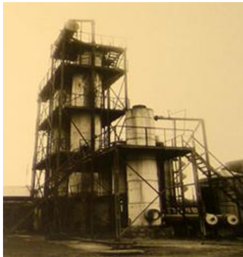
Установка термического крекинга В.Г.Шухова, Баку, СССР, 1934

Выход бензина из нефти можно значительно увеличить (до 70%) путем расщепления углеводородов с длинной цепью на углеводороды с меньшей относительной молекулярной массой. Такой процесс называют крекингом (от англ. to crack – расщеплять).