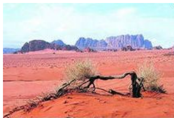
Испытка. Если не остановить вырубку леса, черная станет красной