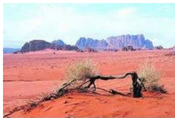
Испыль. Если не остановить вырубку леса, черным станет лесок.