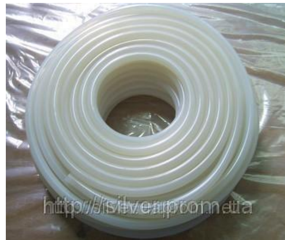
Шланг силиконовый термостойкий