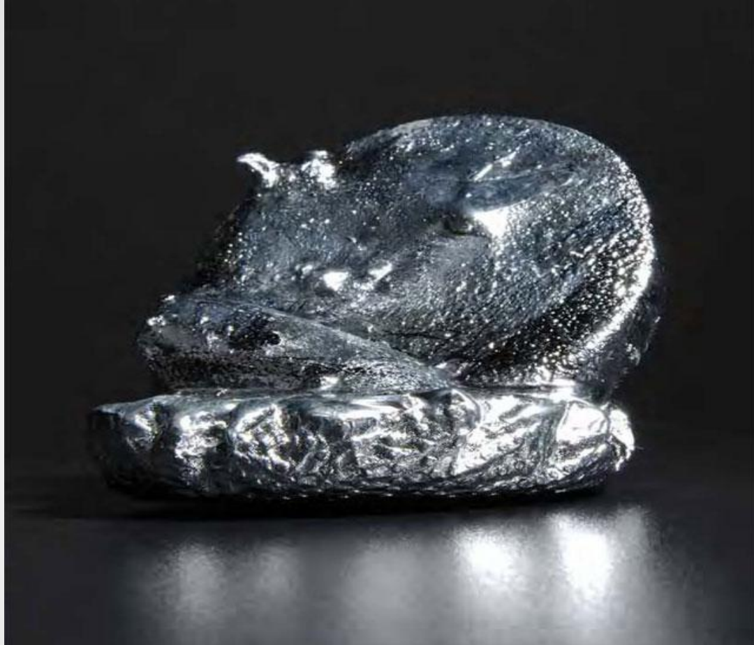
Никель в “чистом виде”