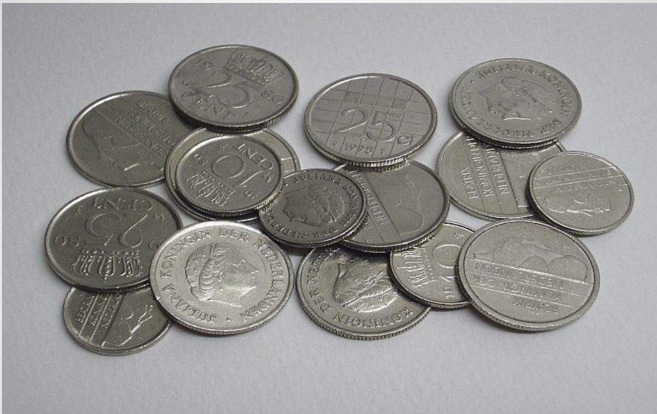
Монеты из никеля