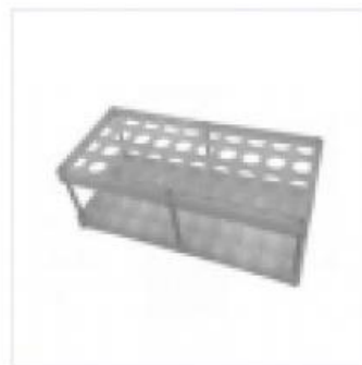
Штатив для Пробирок