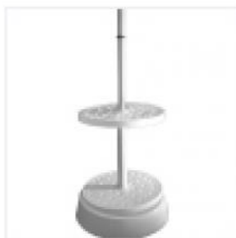
Штатив для Пипеток