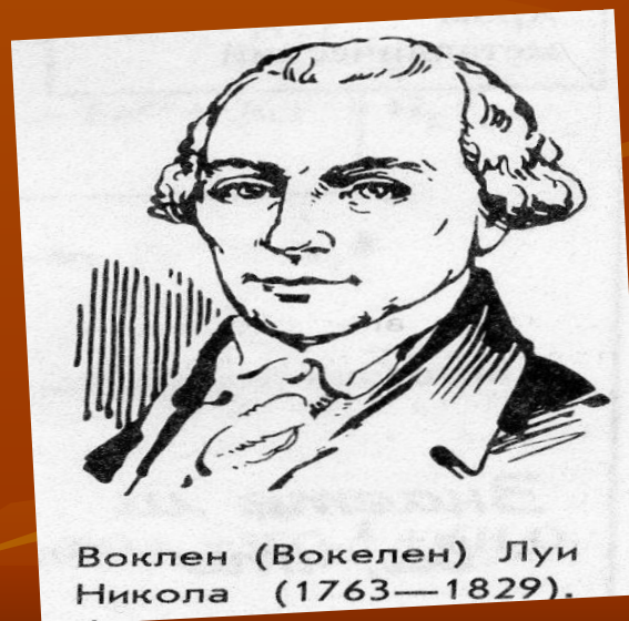
Воклен (Вокелен) Луи Никола (1763—1829).

. Название «хром» предложили друзья Воклена, но оно ему не понравилось – металл не отличался особым цветом. Однако друзьям удалось уговорить химика, ссылаясь на то, что из ярко окрашенных соединений хрома можно получать хорошие краски.