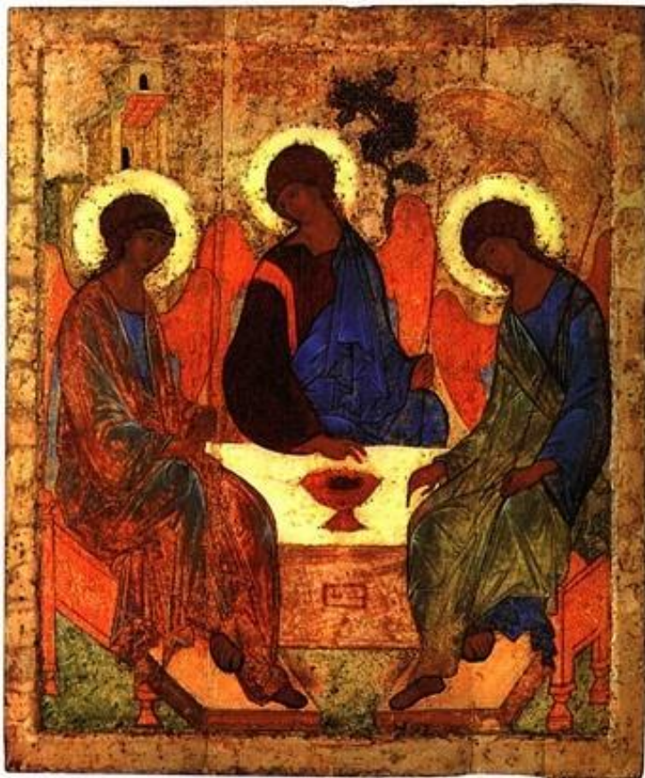
Андрей Рублев. «Троица». 1420-е годы