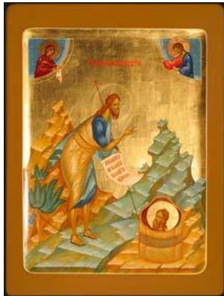
Икона «Иоанн Предтеча», современный мастер