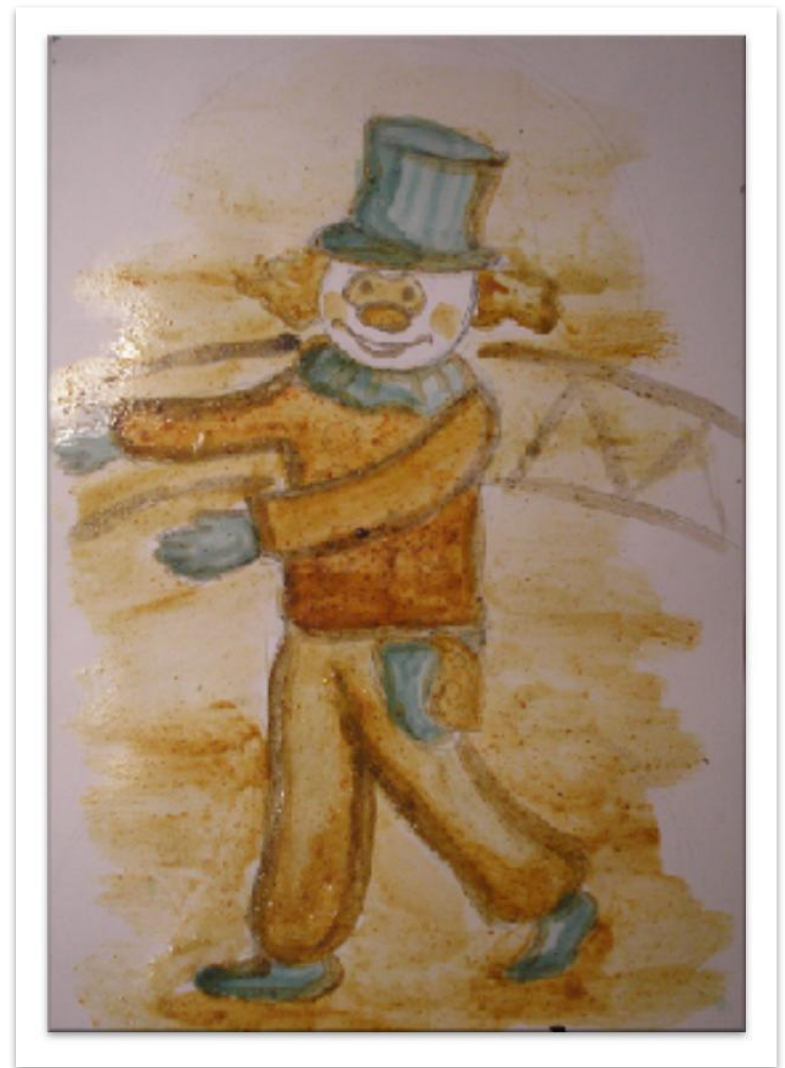
Буянкина Екатерина Веселый клоун 2008, яичная темпера