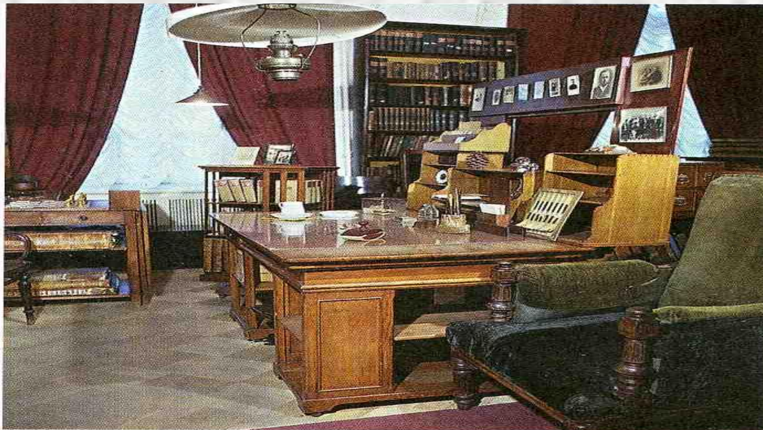
Кабинет Д.И. Менделеева