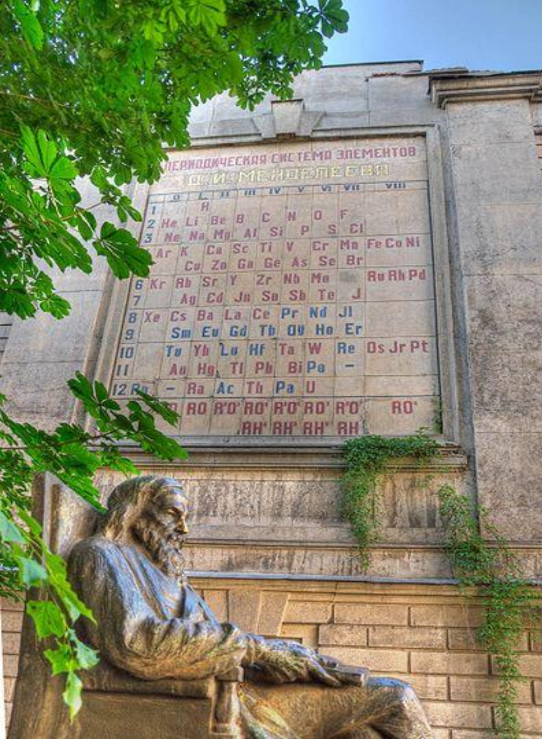
Памятник Д.И. Менделееву в Санкт-Петербурге